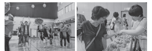
なのみ学園おどり隊

8月28日(日)に福岡市南区清水町内の4施設合同で「第19回清水ふれあいまつり」が開催されました。なのみ学園の保護者や関係者・住民の方など多くの方が来場されました。利用者の方はそれぞれ催し物の担当を持ち、もてなす側として活躍されました。また、障がい者スポーツセンターのメインステージではなのみ学園おどり隊による踊りを披露しましたが、1ヶ月間の練習の成果が十分に発揮され、利用者さんも大変楽しんで頂けました。(福岡市立なのみ学園 大本 梓織)