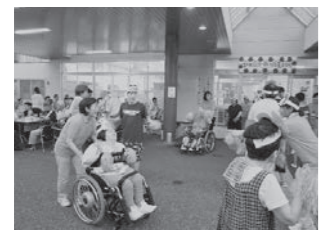
「エビカニクス」で踊っちゃおう!