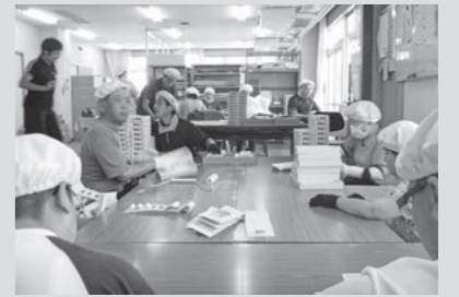
有名店の箱折り!責任重大!

福岡市東区に障がい者の方が通うふよう学園があります。その中の簡易班の作業内容は、お菓子の箱折りで、福岡県のお土産で有名なお菓子やめんたいなどの箱を利用者16名で1日約3,000個組み立てます。組み立て・トレー入れ・点検など工程を細かく分け一工程につき一人が責任を持って作業します。利用者の方に作業の方法を分かりやすく伝え、「安全に」「効率良く」「集中して」多くの箱を完成させます。楽しさややりがいを感じていただけるように努めています。8月より「玉露まんじゅう」が新しく加わり忙しい日々が続いていますが、利用者・職員共に楽しみながら丁寧な箱作りに取り組んでいます。 (福岡市立ふよう学園 中橋 薫)