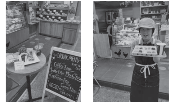
いらっしゃいませー!

少しずつですが、常連のお客様も増えています。店先でお客様とお話することも楽しみの1つです。商店街の方も声をかけてくださったり、保護者の方も近くまで来たので・・・と寄っていただいたり、みなさまに支えられています。現在、月、火の2日間ですが、利用者みなさんが交替で販売活動に参加しています。商店街に元気な呼びかけが響いています。ぜひ、近くにお越しの際はみなさまのご来店をお待ちしております。 (福岡市立なのみ学園 小川 美佐)