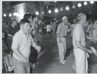
みんなで一緒に「炭坑節」♪

8月18日(木)、今津福祉村納涼盆踊り大会が松濤園中庭で行われました。利用者みなさんが毎年楽しみにしている夏の行事ですが松濤園最後の盆踊りになりました。ジュースや綿菓子などを食べ、ステージでの催し物を楽しみました。また最後には日中活動の合間に練習した「炭坑節」を地域の方と一緒に踊りました!!利用者さんの最高の笑顔で今年の夏も終わり、良い思い出となりました。 (第一野の花学園 佐々木 萌)